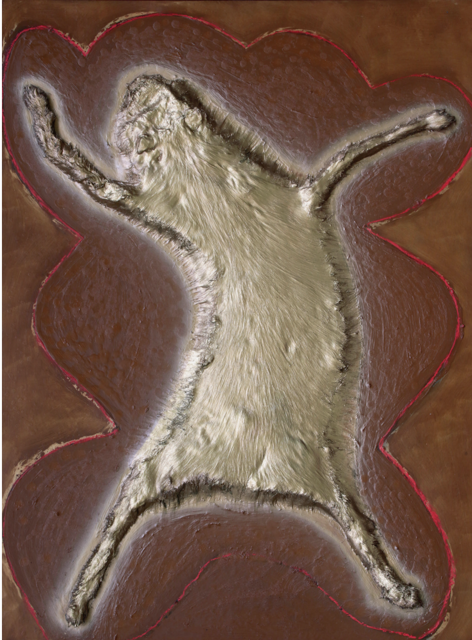
Crucifixion d'une peau de Renard, 79 x 104 cm, 2024