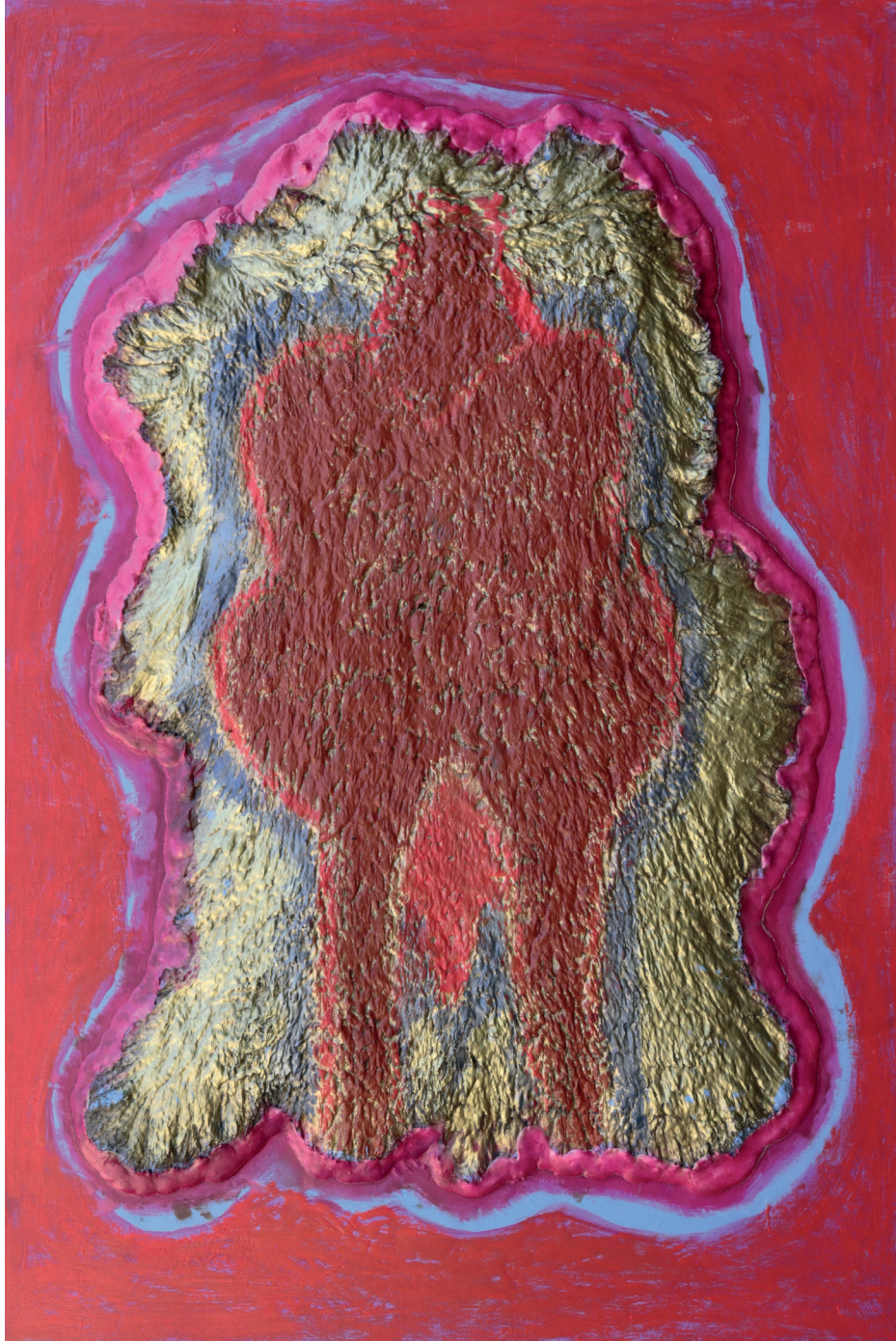
Peinture sur peau de Mouton, 80 x 110 cm, 2024