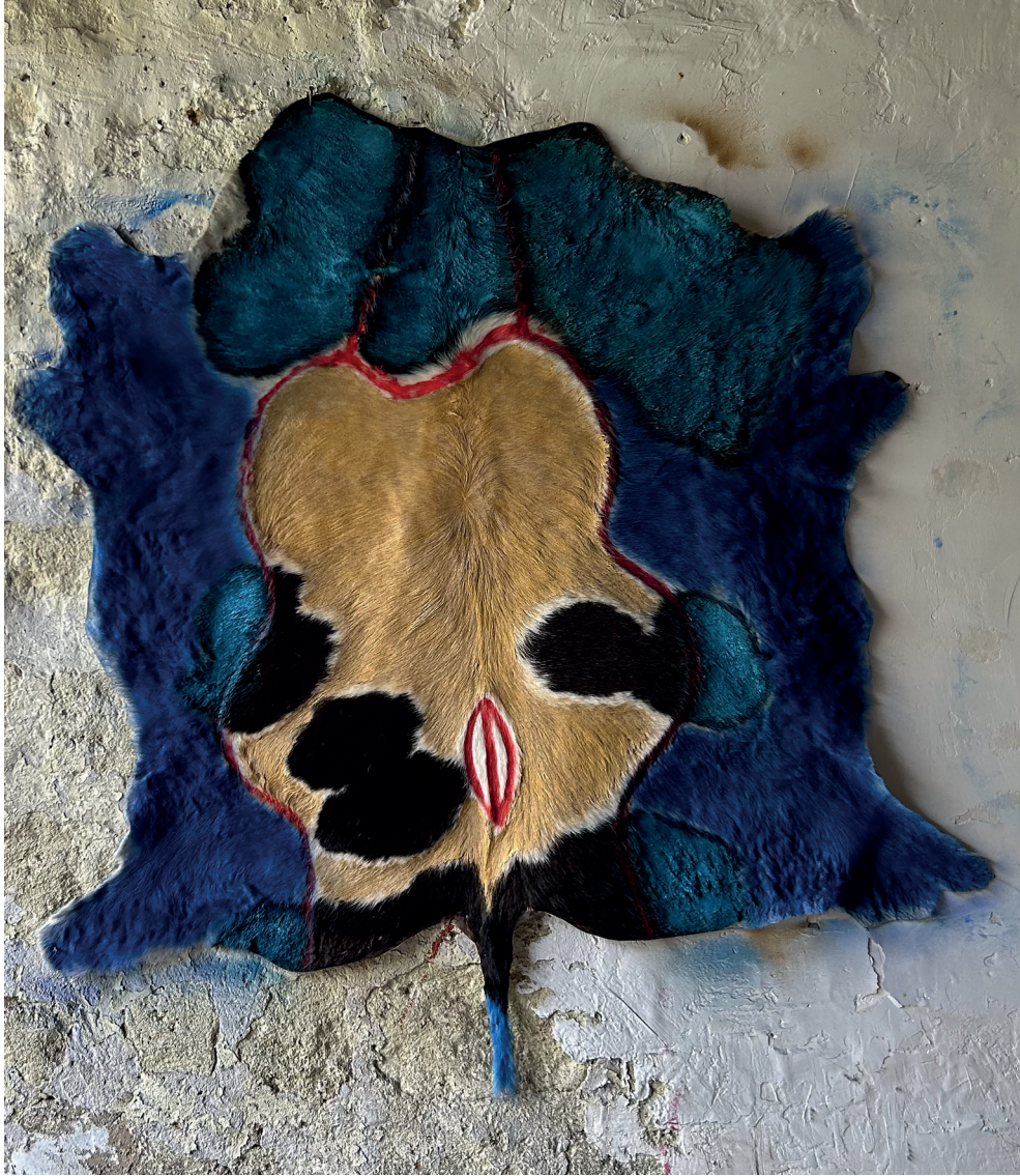
Peinture sur peau de vachette, 147 x 124 cm, 2024