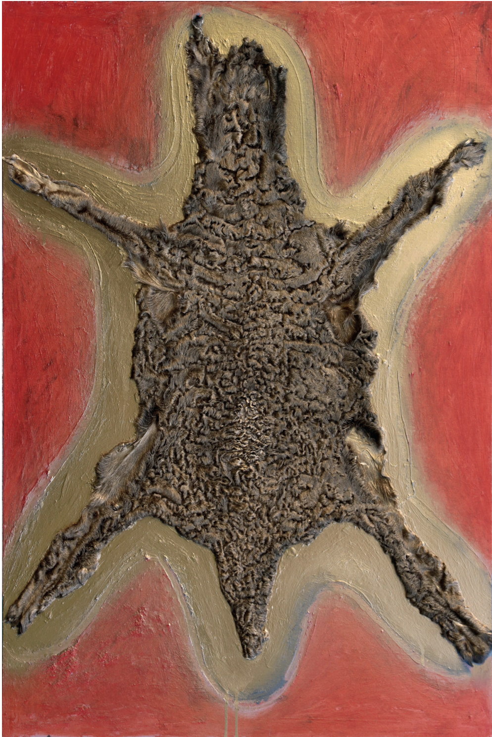
Peinture sur peau d'Astrakan, 69 x 94 cm, 2024