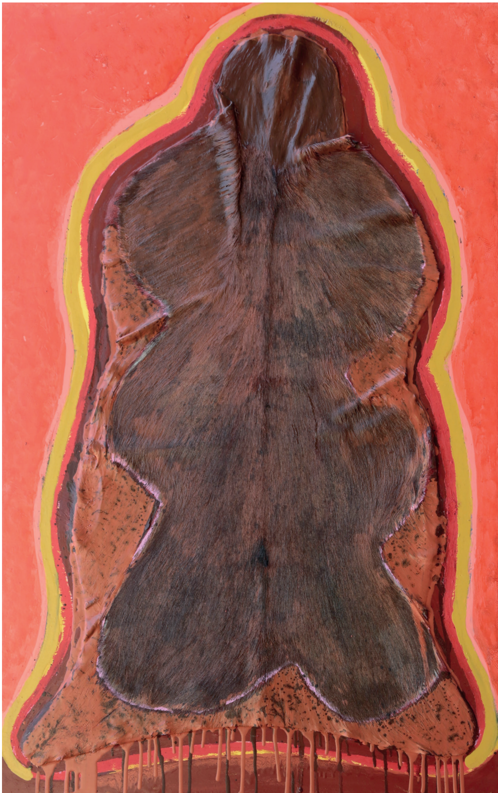
Peinture sur peau de Chèvre, 70 x 110 cm, 2024