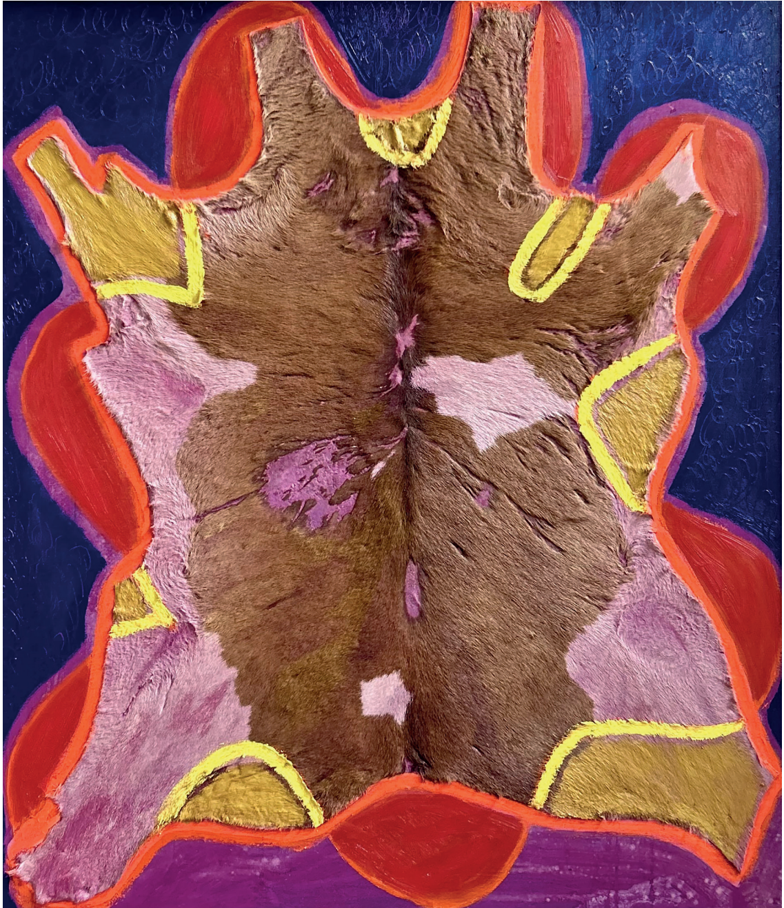
Peinture sur peau de Vachette, 114 x 129 cm, 2024